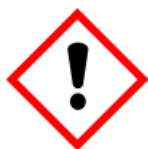
GHS07 - dráždivé látky