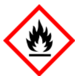
GHS02 - hořlavé látky

Výstražné symboly nebezpečnosti – označování nebezpečných chemických látek a směsí, např.: