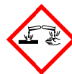
GHS05 - korozivní a žíravé látky