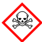
GHS06 - toxické látky