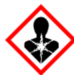
GHS08 – látky nebezpečné pro zdraví